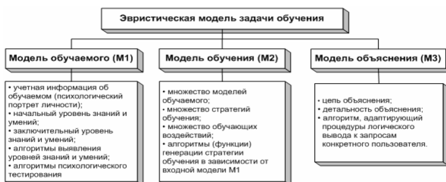
Рис. 2. Эвристическая модель задачи обучения

Поэтому с точки зрения адаптивного представления динамической модели управления обучением в ИОС рассмотрение эвристической модели задачи обучения M включает построение трех следующих подмоделей (рис. 2): модель обучаемого ( M1 ), модель обучения ( M2 ), модель объяснения ( M3 ).