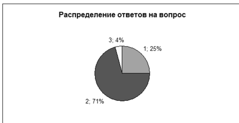
Табл. 3. показывает, что нагрузка студента в ТТИ ЮФУ вполне нормальна. В данной связи необходимо очень осторожно подходить к реформированию организации учебного процесса в ТТИ ЮФУ. Подавляющее большинство студентов одобряет сложившиеся традиции организации их учебной деятельности.