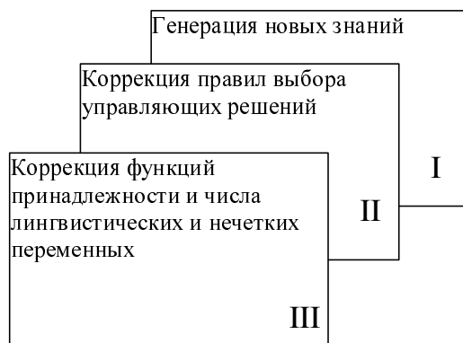
Рис. 3. Варианты самоорганизации баз знаний

Анализируя возможности получения и коррекции новых знаний, выделим три независимых варианта самоорганизации баз знаний, показанных на рис. 3.