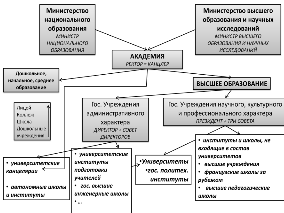
Рис. 1. Структурная схема системы государственного образования Франции

Принцип участия заключается в том, что в управлении государственными учреждениями научного, культурного и профессионального характера и в организации учебного процесса принимают участие избранные в совет преподаватели, административный персонал, студенты. Присутствие в советах лиц, не являющихся студентами или работниками данного учреждения (например, представителей региональных предприятий, общественных организаций, представителей зарубежных университетов), обеспечивает участие данного учреждения в жизни региона и государства.