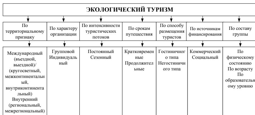
Рис. 2. Виды и формы экологического туризма