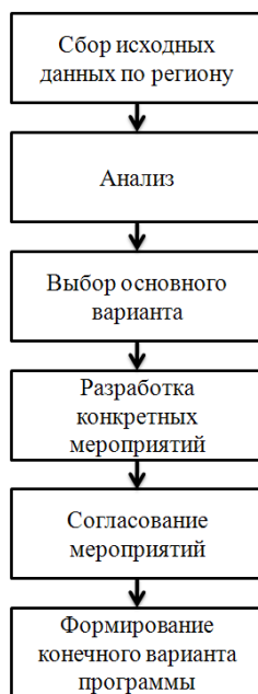
Рис. 2. Последовательность разработки программы развития региональной рыночной инфраструктуры

Последовательность представлена также на рис. 2.