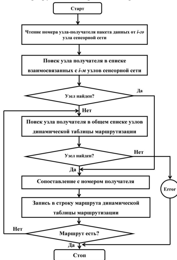
Рис. 3. Алгоритм построения трассы передачи данных от i -го узла произвольному узлу беспроводной сенсорной сети

Алгоритм построения трассы передачи данных от i -го произвольному узлу по динамической таблице маршрутизации, приведен на рис. 3.